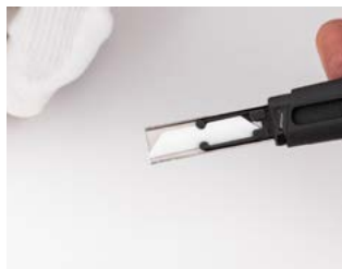
ostrze musi pasować w uchwycie