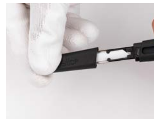
włóż z powrotem osłonę ostrza