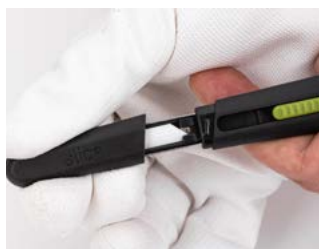
Chwyć za osłonę ostrza i wysuń ją do przodu