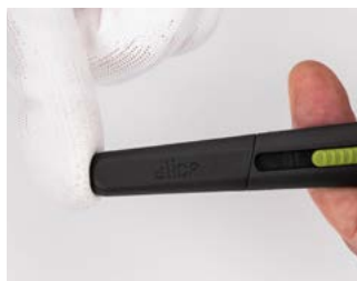
osłona ostrza musi się zatrasnąć

Dla zwiększenia bezpieczeństwa przeczytaj uważnie poniższe wskazówki i stosuj się do nich. Prosimy o ostrożność podczas używania noża.