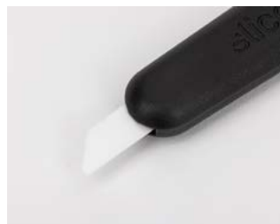
nóż jest gotowy do użycia