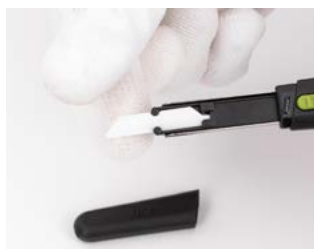
chwyć za ostrze