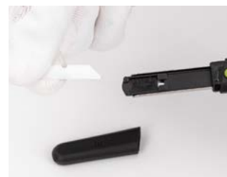
chwyć je i wyciągnij